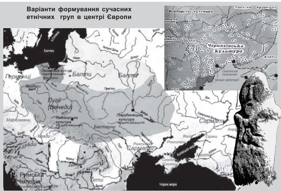
Варіанти формування сучасних етнічних груп в центрі Європи

Була поширена у верхів'ї Дніпра і вище, за участі слов'ян, балтів та фіно-угрів . Характерними є городища, укріплені валами і ровами у важкодоступних місцях, навколо яких розміщались селища. Населення займа-