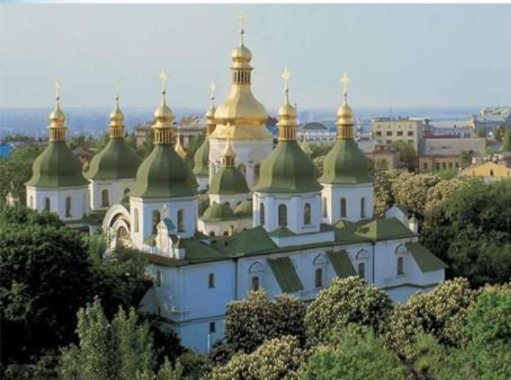
Софія Київська. Південно-західний фасад

рі сформувалося мазепинське бароко, яке втілює ідею української державності. Споруджені гетьманом монументальні й величні храми були пройняті пафосом сильної авторитарної влади. Ці риси дістали відображення й у відновлених за Мазепи давньоруських храмах, зокрема в Софії Київській, у якій форми давньоруського хрестово-банного храму було органічно контаміновано з формами західноєвропейської базиліки й елементами української національної архітектури. Впродовж усього XVIII ст. тривало і створення нового, барокового стінописного ансамблю Софії Київської. Ядро його склали зображення семи Вселенських соборів, що пишним фризом оточили підбане-