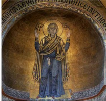
Фреска, Миколаїв, 1702