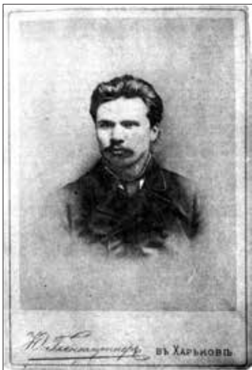
Д. І. Яворницький. Фото. 1885 р. Харків

Основою цієї праці стало десятирічне вивчення життя й воєнних діянь запорізьких козаків, які прославилися безсмертними подвигами в боротьбі за віру, народність і вітчизну. Вся «Історія запорізьких козаків», за планом автора, вийде в трьох томах, причому перший том присвячений виключно зображенню внутрішнього побуту запорізької громади, другий і третій томи присвячені фактичному викладу подій козацьких діянь, починаючи з кінця XV й закінчуючи другою половиною XVIII ст. 1 Головним джерелом при зображенні долі Запоріжжя, крім друкованих українських літописів, польських хронік та різних мемуарів, для автора праці слугували писані документи, розкидані в ба-