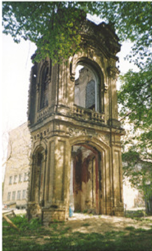
Бехтеревський провулок, 8. Рештки будинку та деталь оздоблення