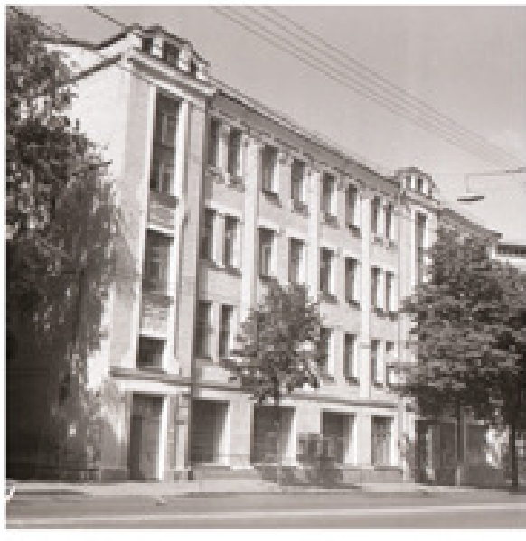
Січових Стрільців, 75

павичів, що ефектно виділяються на тлі зеленої полив'яної плитки. Ця гра кольорів додавала виразності й надвіконним композиціям із химерою.