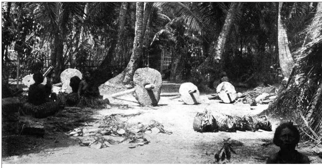
■ «Кам'яні гроші» перед житлом місцевих мешканців на одному з островів південної частини Тихого океану. Фото початку ХХ ст.

янки первісних людей, обсидіан вивозили іноді за кілька сотень кілометрів від тих місць, де його видобували. Те саме можна сказати і про інший матеріал, що зазвичай ішов на виготовлення первісних знарядь праці — кремій . Численні археологічні знахідки дають можливість з повною впевненістю стверджувати, що у прадавні часи саме кремій і обсидіан правили за своєрідну «тверду валюту» , що її можливо було виміняти на інші корисні речі — шкіри тварин, морські мушлі, прянощі, сіль і таке інше.