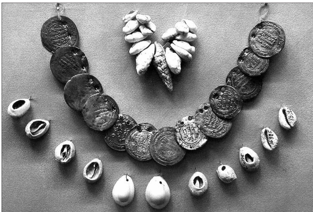
■ Упродовж кількох століть мушлі каури поруч із срібними арабськими дирхемами були в обігу на землях Русі. На фото — знахідка з поховання X ст., дослідженого на Середньому Дніпрі. Експозиція Національного музею історії України.

Перевагою металів було те, що їх можна було легко ділити на частини, а потім знову переплавляти. До того ж, метали не боялися вогню і не псувалися від зберігання. Зберігати їх можна було практично вічно.