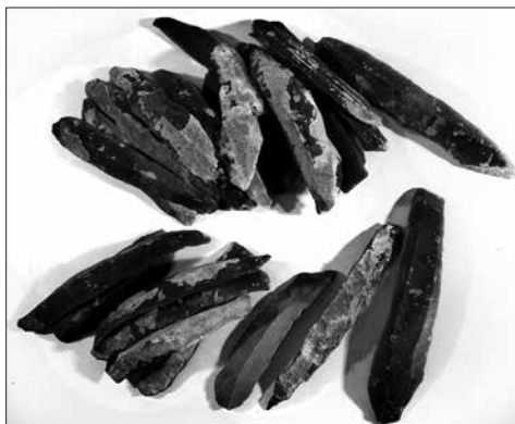
■ Скарб із кременевих пластин, Середнє Подніпров'я, трипільська культура, IV тис. до н. е. Кременеві пластини могли виконувати у кам'яному віці функції грошей. У цьому скарбі, знайденому у горщику, налічувалося 150 пластин, видобутих на Волині, за сотні кілометрів від берегів Дніпра.

Причому, як показують розкопані і досліджені археологами сто-