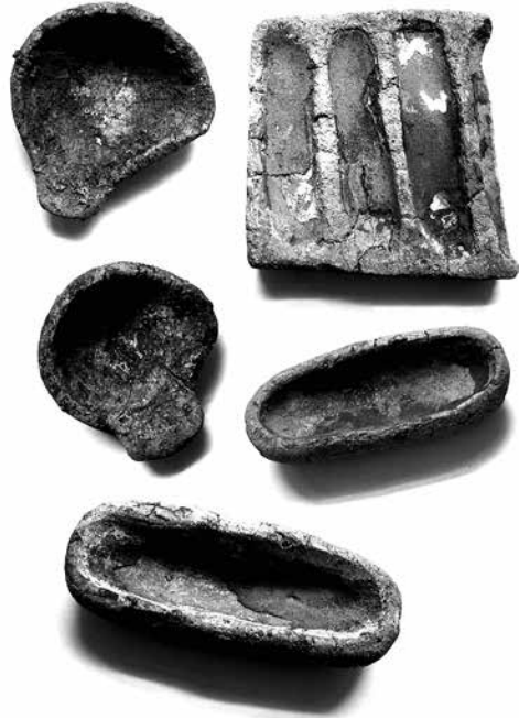
■ Набір форм та льячок із поховання ливарника, датованого першою половиною III тис. до н. е. на Херсонщині (катакомбна культура, розкопки А. І. Кубишева. Археологічний музей НАН України).

Ідея створення металевих грошей прийшла людям не одразу. Однак навчившись видобувати та обробляти метали, народи багатьох країн поступово стали використовувати метали як гроші. Причому метали виявилися настільки зручні для такого використання, що досить швидко витіснили більшість інших форм грошей.